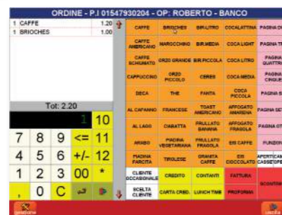
VENDITA A BANCO