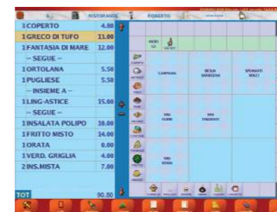
ESEMPIO DI COMANDA